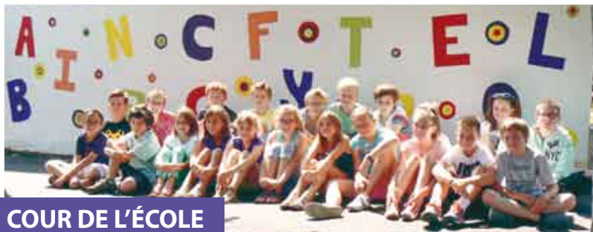
COUR DE L'ÉCOLE

Les travaux de réfection de la cour de notre école sont terminés. La remise en place du jeu dans la cour de l'école maternelle, la résine autour des arbres, une marelle et une fresque réalisée par les enfants de l'école dans la cour de l'école élémentaire apportent une touche colorée à cette cour. Cet ensemble scolaire est donc un bel outil de travail pour les enseignants et les 169 élèves répartis en 7 classes. En 2016, l'arrivée de la fibre viendra également compléter et améliorer le réseau informatique de notre école.